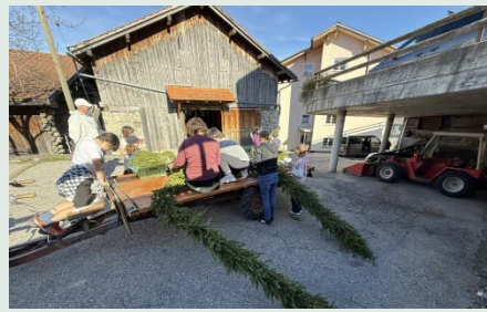
Die Eltern der Erstkommunikanten bei den Vorbereitungsarbeiten für das Fest.

Jugendlichen war es eine echte und sehr berührende Begegnung – fern aller Klischees – dank seiner Einfachheit, Offenheit und Menschlichkeit. Selbstverständlich kam auch der gesellige Teil nicht zu kurz, welcher ebenfalls von allen Teilnehmenden in gebührender Masse genossen wurde.