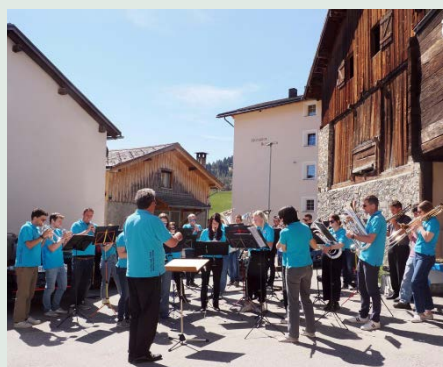
Festliche Klänge der Musica Instrumentala Salouf Mon Stierva.