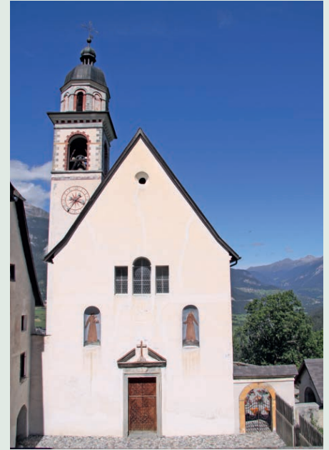
Für die Pfarrkirchen Son Franzestg, Mon